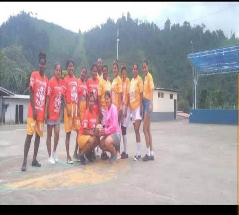
ENCUENTRO DEPORTIVO CON JOVENES DE LA PARROQUIA VUELTA LARGA