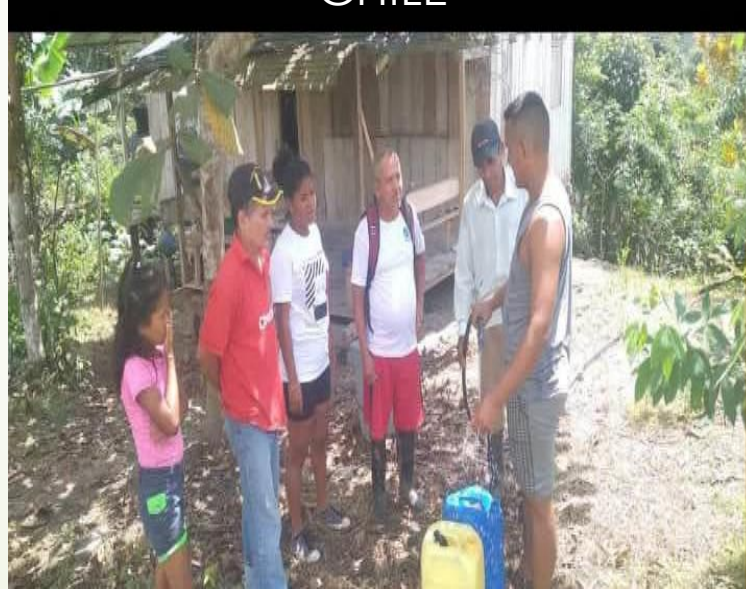
ENTREGA DE MATERIALES EN LA COMUNIDAD POZA DE CHILE