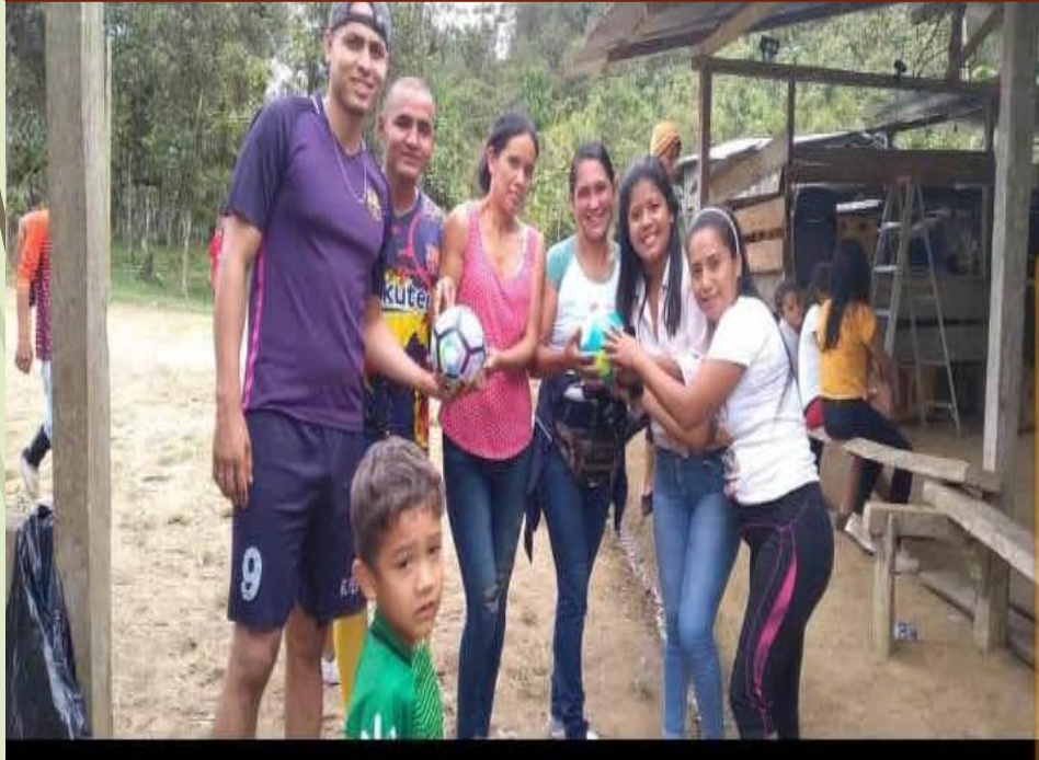
ENTREGA DE BALONES EN LA COMUNIDAD 22 DE DICIEMBRE