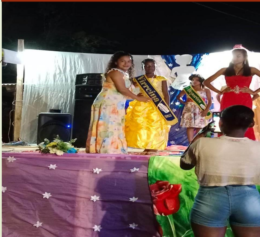
Apoyo en festividades de la comunidad de Morachigüe