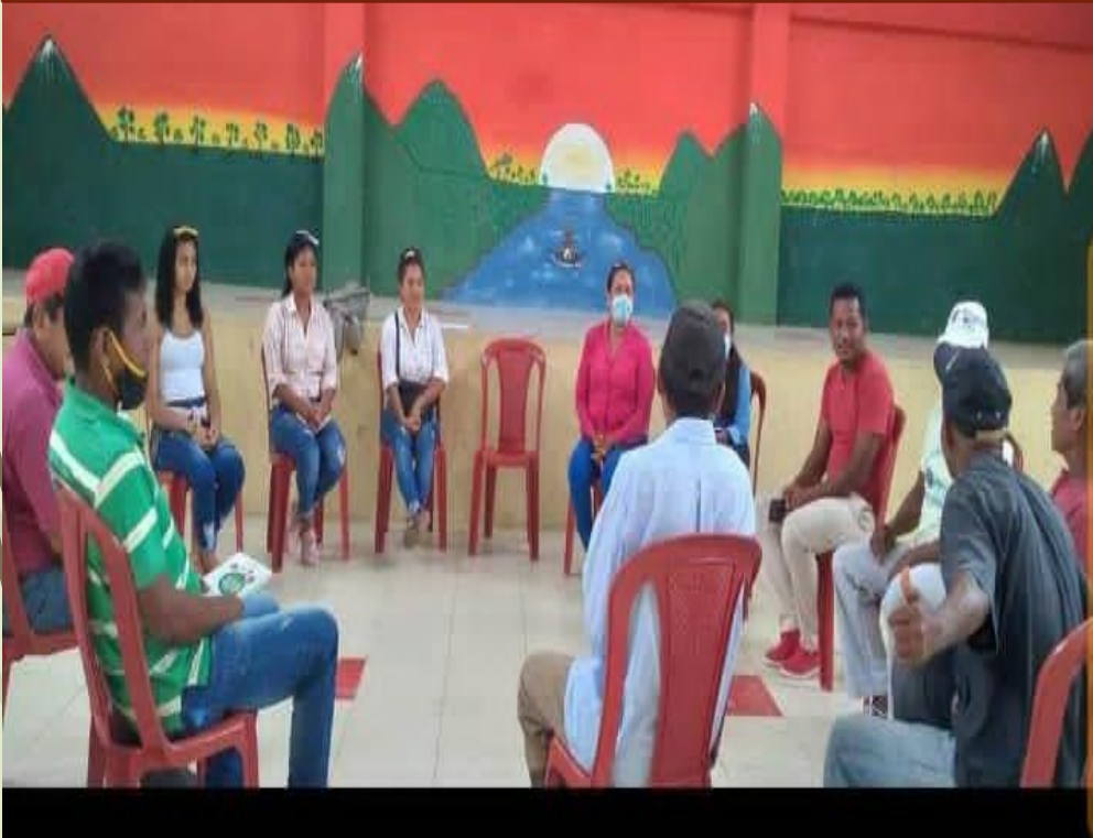
REUNION PARA CONFORMACION DE COMISION DE SEGURIDAD