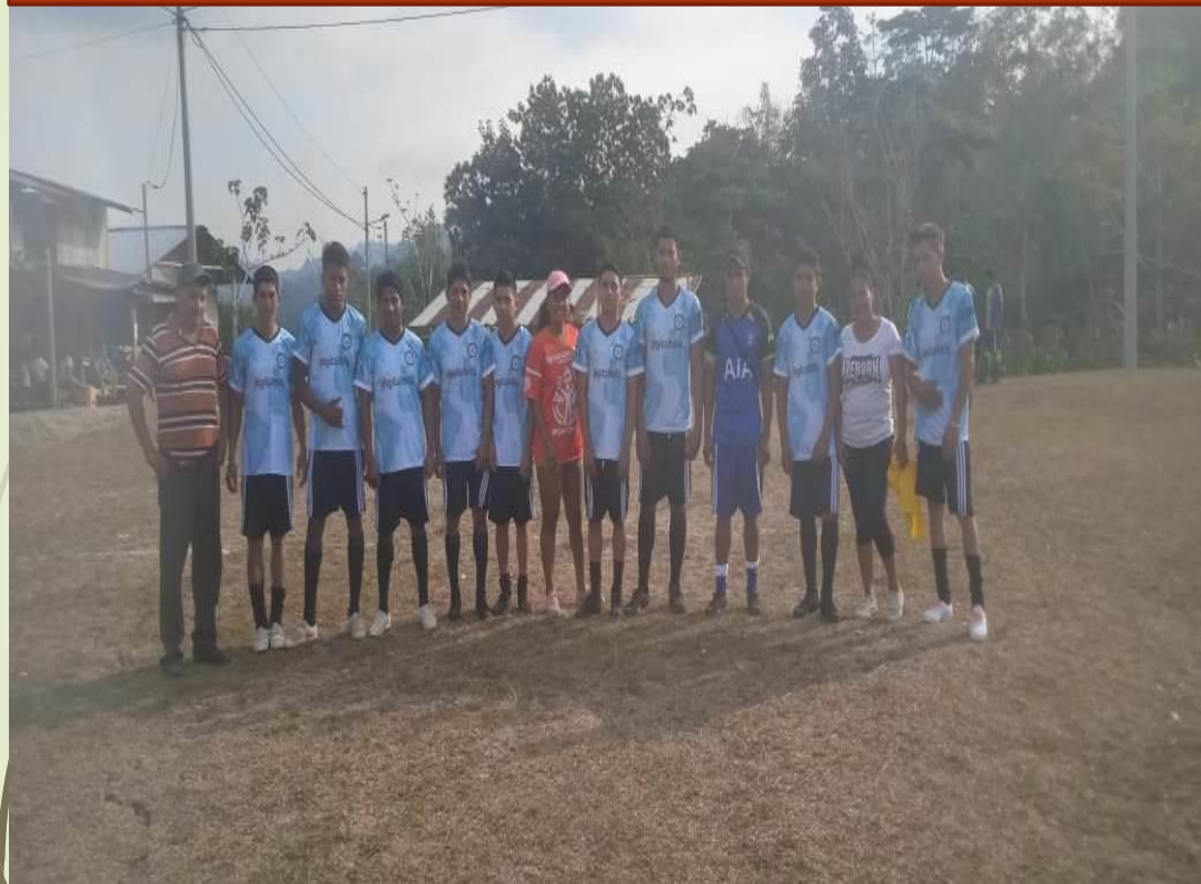
Entrega de uniforme Poza de Chile