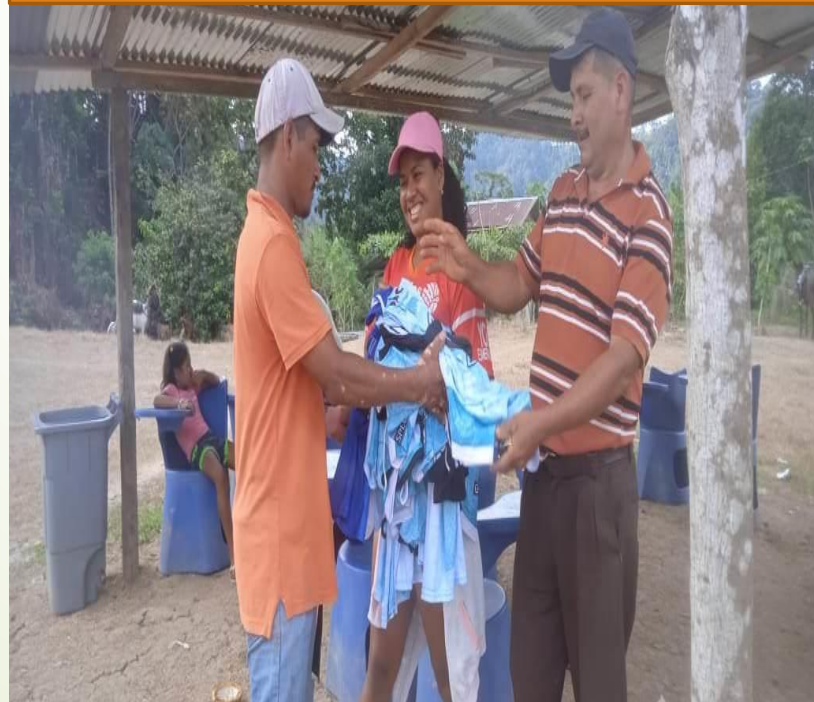
ENTREGA DE UNIFORME DEPORTIVO A LIDER DE LA COMUNIDAD POZA DE CHILE