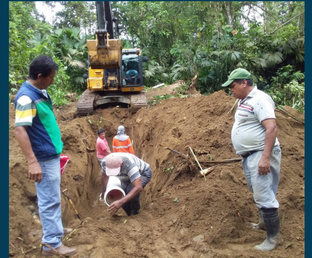
INSTALACIÓN DE TUBOS Agua Potable para el Centro Poblado