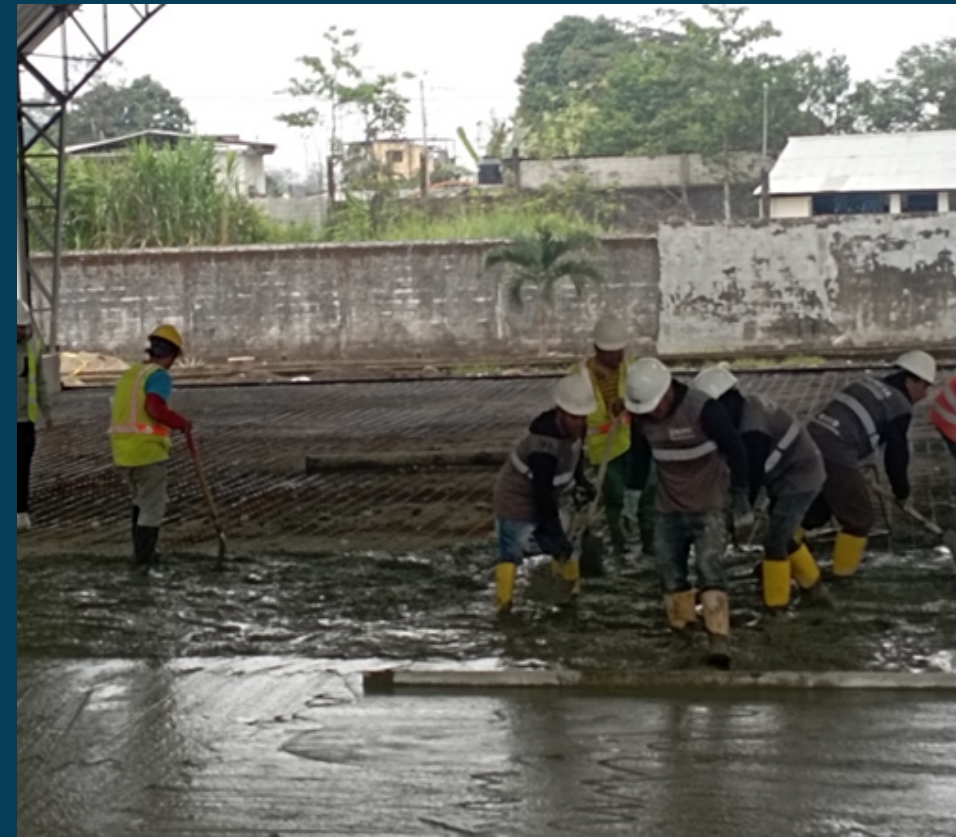
RECINTO FERIAL DE LA PARROQUIA VALLE CONSTRUCCIÓN DE GRADERIO Y ADECUACION DEL PISO PARA CANCHA DE USO MULTIPLE