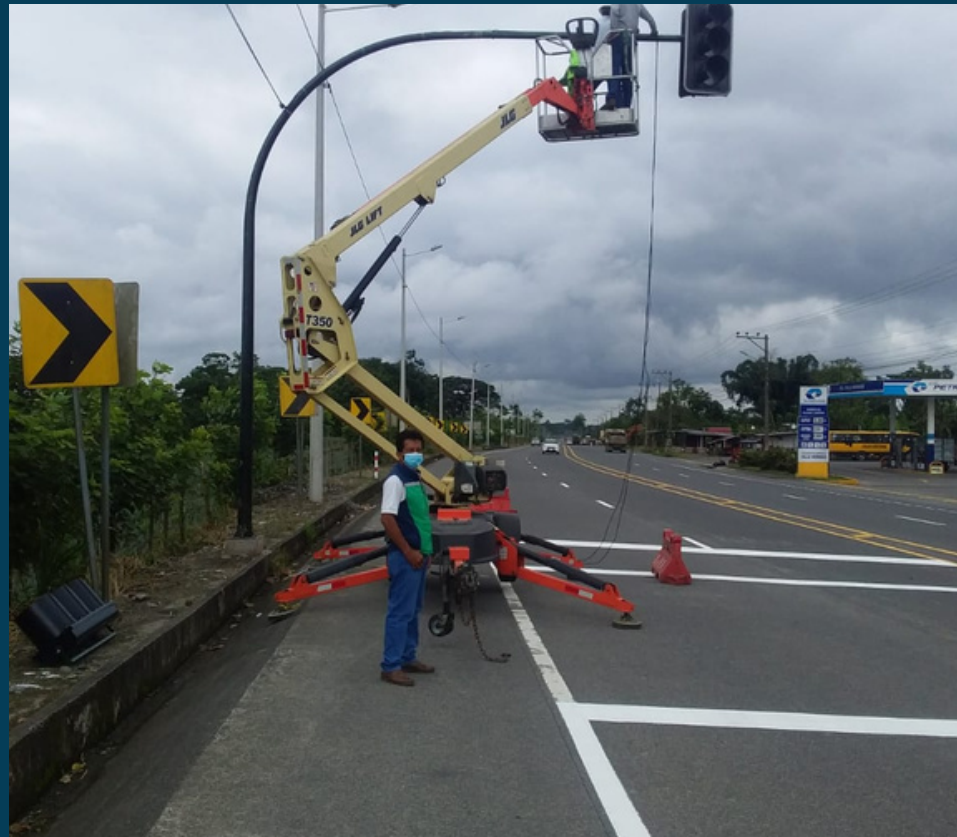
MANTENIMIENTO DE SEMÁFOROS Y SEÑALIZACIÓN Instalación se semáforos