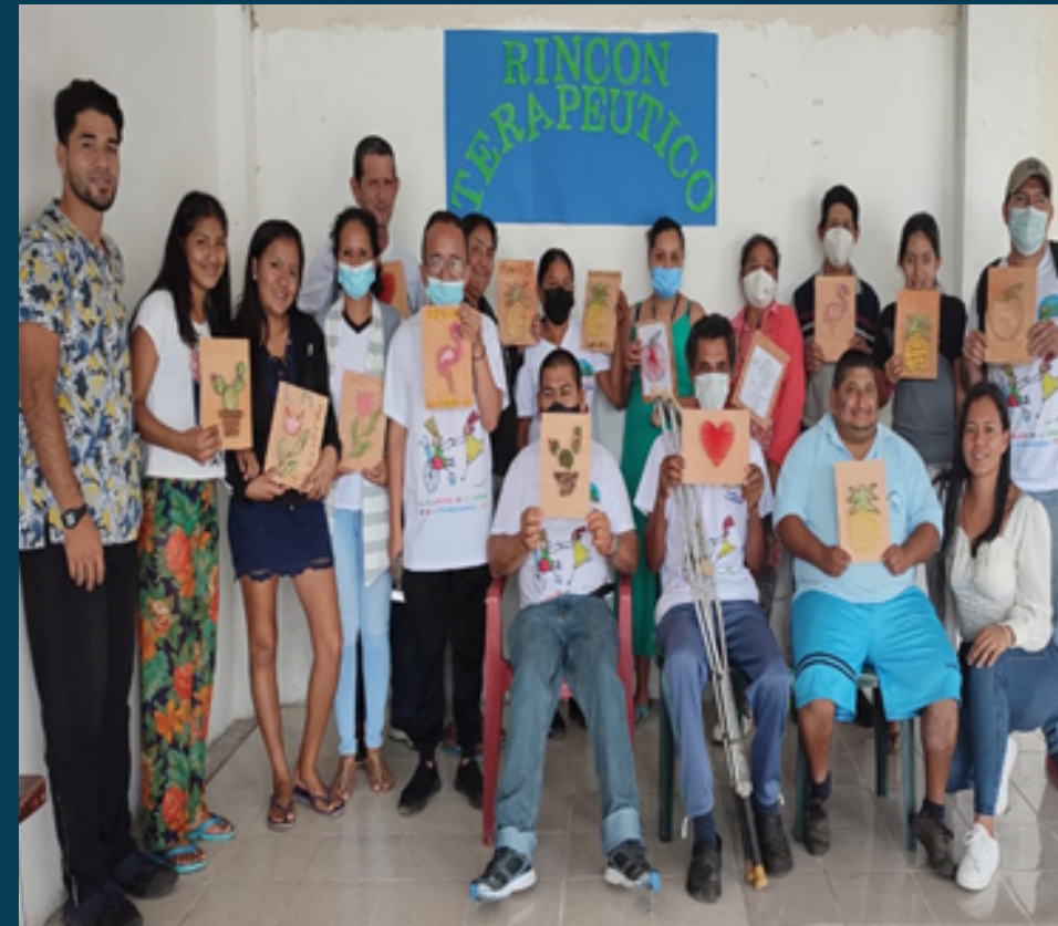
PROYECTO SOCIAL Taller ocupacional "Elaboración de Cuadros con la tecnica Hilograma"