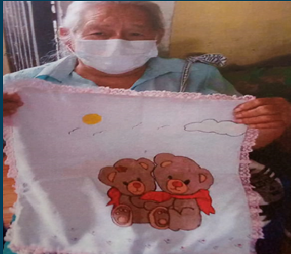
ADULTO MAYOR TALLER OCUPACIONAL "ELABORACIÓN DE ALMOHADAS"