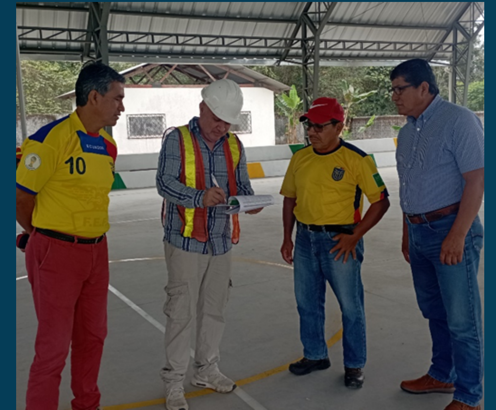
RECINTO FERIAL DE LA PARROQUIA VALLE CONSTRUCCIÓN DE GRADERIO Y ADECUACION DEL PISO PARA CANCHA DE USO MULTIPLE