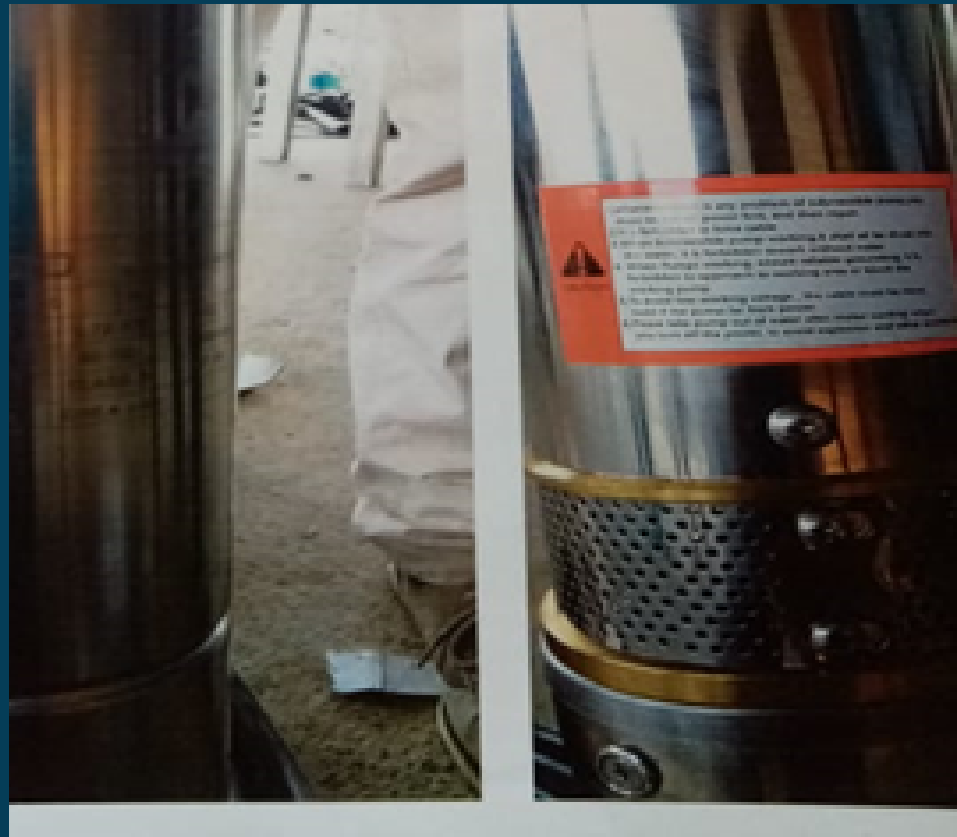
RECINTO EL TRIUNFO Proyecto de entrega de bomba de agua