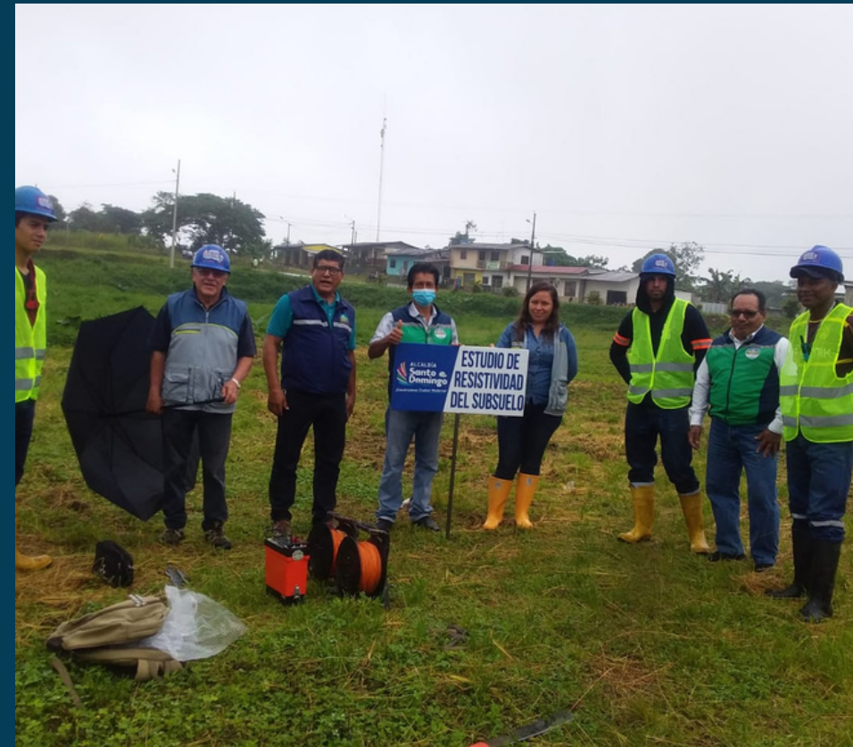
APOYO EN EL ESTUDIO DE RESISTIVIDAD DE SUELOS Recinto Cristóbal Colón con el contratista para la perforación del pozo profundo