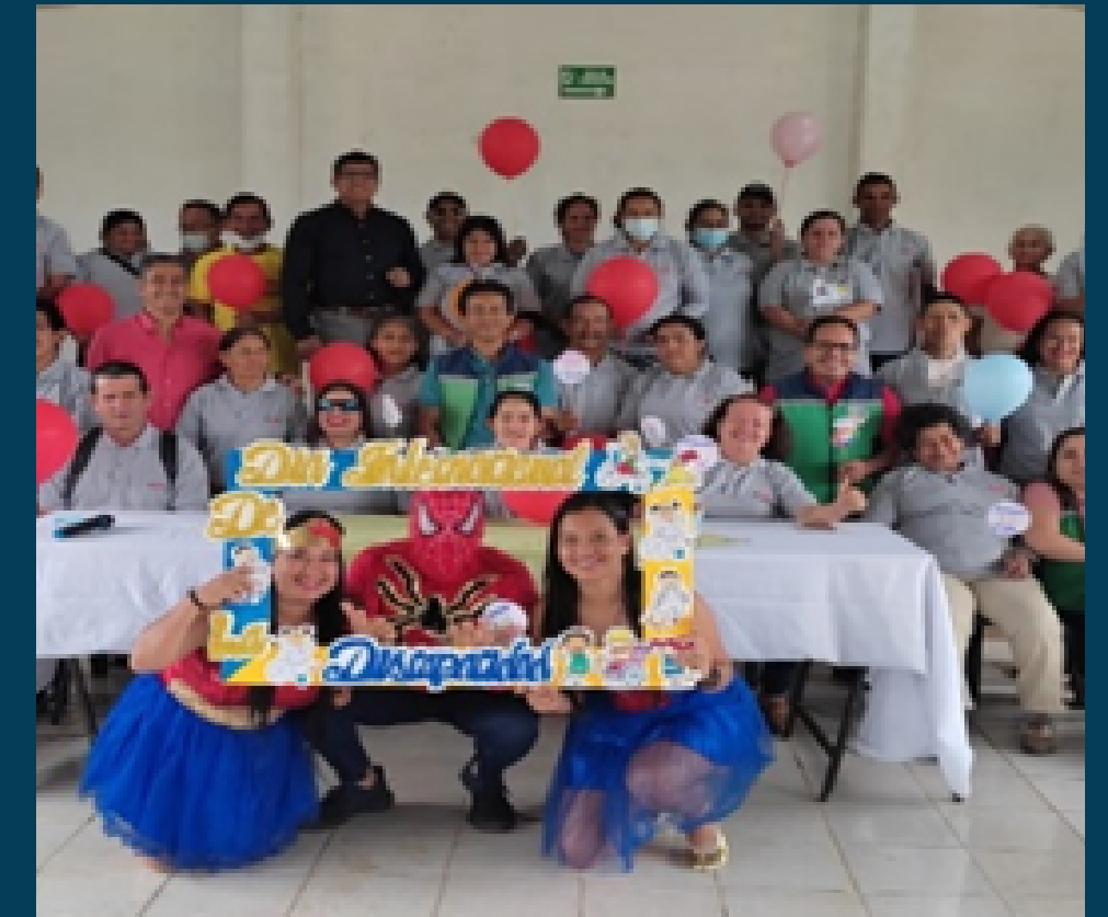
PROYECTO SOCIAL Sencibilizacion por el Dia Internacional de la Personas con Discapacidad.