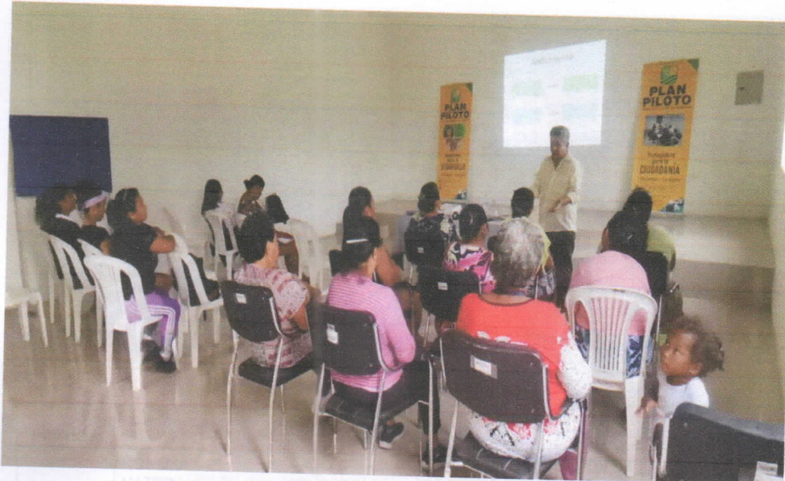
75.06.06 MATERIALES DE CONSTRUCCION PARA OBRAS DE CAPACITACION A LA CIUDADANIA EN TEMA DE EMPRENDIMIENTOS 2.042,25